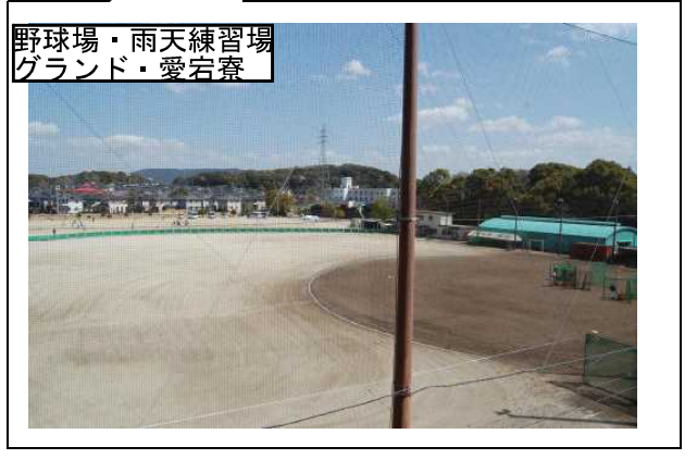
野球場・雨天練習場 グラウンド・愛宕寮