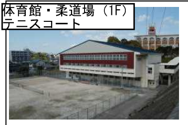
体育館・柔道場(1F) テニスコート