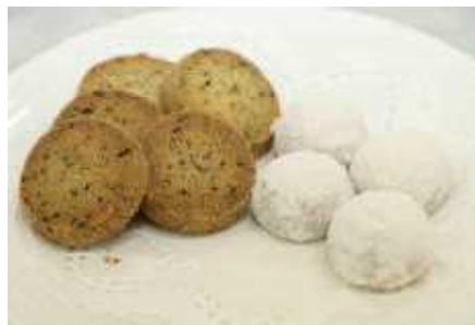
バオバブのクッキー

面積 日本の約3分の1 人口 1862万人 公用語 英語とチェワ語 四国の1.5倍あり世界遺産でもあるマラウイ湖やサファリに代表される、豊かな自然環境と農業が主体の経済。 人柄については、「Warm Heart Of Africa」の愛称があり「知らない人の手助けをする」指数で世界10位。